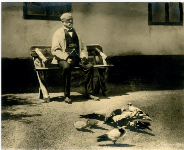
Antonín Dvořák auf seinem Sommersitz in Vysoká

stände. Nach zwei äußerst erfolgreichen Jahren als Direktor des National Conservatory of Music of America in New York und nach dem Sensationserfolg seiner neunten Sinfonie nahmen ihm die unzähligen Verpflichtungen den künstlerischen Atem. Und auch die Sorge um die Daheimgebliebenen plagte ihn so sehr, dass er das Experiment „Neue Welt“ abbrach und sich Hals über Kopf auf den Heimweg machte.